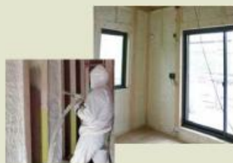
ノンフロン・ノンホルムによる健康・環境にやさしい断熱工法