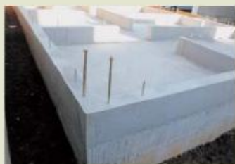
高耐震を誇る頑丈な一体型基礎