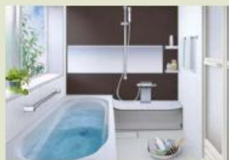
保温性の高い浴槽やカラリ床など、家族に優しいユニットバスを採用