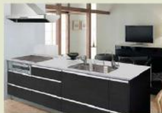
多くの収納スペースやゆったりシンクなど奥行き満足度の高いシステムキッチン