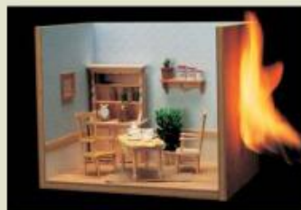
優れた耐火性を発揮する「ダイヤライト」