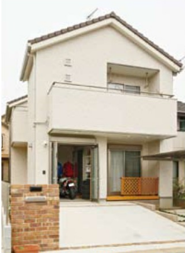
白いタイル調のサイディングが上質な佇まいを演出するY氏邸外観。正面にバイクガレージが見えている