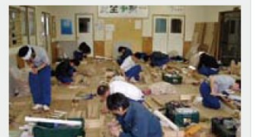
真剣に木工に取り組む生徒たち。テクニカルセンターは厳しい中に温かな雰囲気がある

近藤建設は独自に大工養成の学校「テクニカルセンター」を擁している。単に職人を育成するだけでなく、木造建築のすべてを知り尽くしたプロフェッショナルを育てることが目標だという。授業では実技以外にも、挨拶やマナー教育を通して、人間的な自立と責任感を養っている。