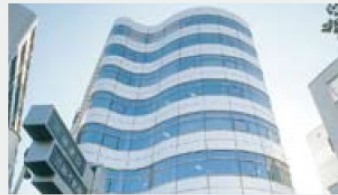
近藤建設本社ビル。グループ力を生かした施工主目線の家づくりの拠点がここにある

近藤建設はKONDOグループの一翼を担う住宅建築会社だ。グループ内では不動産事業やリフォーム、メンテナンス、アフターサービス等の会社がチームを組み、土地探しから家づくりまで、幅広く要望に応じてくれる。48年間の歴史と1万4000棟の実績が安心を支えている。