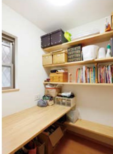
海外経験のあるオーナー夫人は家事室の有用性を現地で学んだ。「独立した家事室は本当に便利」と夫人