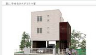
「家づくり羅針盤」のデータをもとに、施主の想いを家づくりのプロがカタチにしている