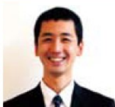
カタクラ展示場 島村卯月

●担当者からご案内 家づくりは人づくりであり、街づくりであると私たちは考えています。単に器としての家づくりではなく、地域に何か貢献できる企業でありたいと思っています。建築現場の清掃はもちろんのこと、駅前の美化清掃や挨拶運動、本社施設の開放など、人と人、人と街をつなぐ活動を続けてきました。これからもお客様目線で、決してウソをつかない家づくりを進めていきます。当社は東武東上線沿線を中心に9つの展示場を構えておりますので、お気軽に足を運んでいただき、展示場で私たちスタッフに声をかけてください。その時から、他ではできない家づくりが始まっています。