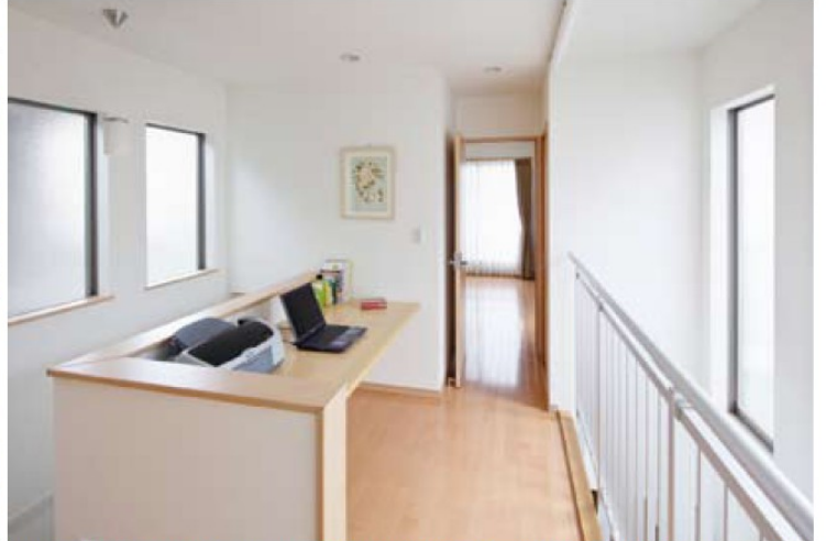
2階ホールは渡り廊下風になっており、右手の手すりからはダイニングやコートが眺められる。「ここには造り付けの多目的カウンターを要望しました。ここで子どもと一緒に自由な時間を過ごせたらいい」とご夫妻