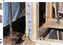
ホールダウン金物

近藤リフレッサーサービス 耐震スタッフより。 昭和56年に建築基準法が改正され、現在の耐震基準 が定められました。昭和56年以前の建物は現在の耐震 基準を満たしていない可能性があります。阪神淡路大 震災以降は平成12年に接合金物が見直され基礎と柱を 結ぶホールダウン金物を装着するようになりました。